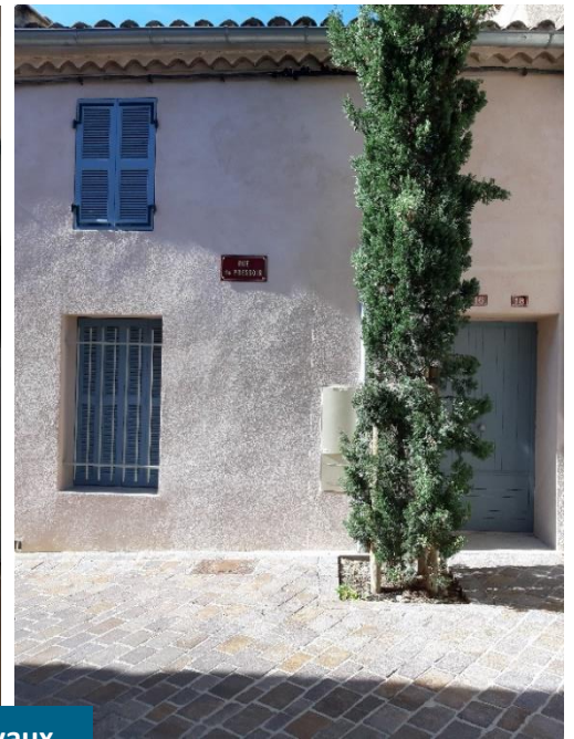
16-18 rue du Pressoir après les travaux