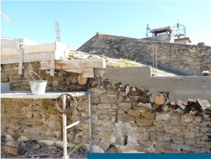
16-18 rue du Pressoir pendant les travaux